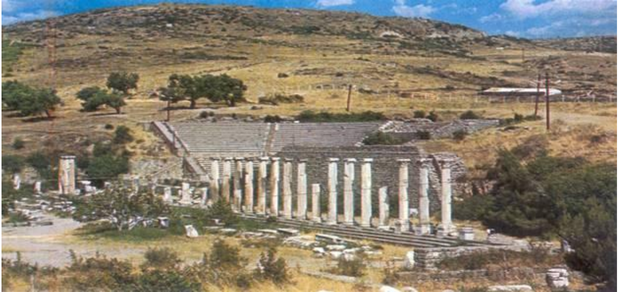
Abb1 Asklepieion: Das Theater und die Säulen der Nordastoa. Das Theater diente der Musiktherapie und der Stimulation positiver Emotionen.

Mit der Degeneration der Asklepieia ging auch das Wissen über die Schlaftherapie verloren [28].